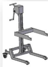
Kołyśka do wałów podpartych dwustronnie