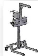
Podnośnik do cylindrów z regulacją poprzeczną