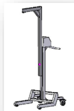
Podnośnik do cylindrów

Wózek może być doposażony w dodatkowe podzespoły ułatwiające przenoszenie i manipulację ciężkimi przedmiotami oraz w napęd elektryczny sterujący podnoszeniem lub opuszczaniem podzespółów.